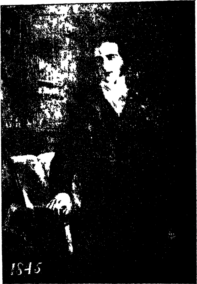
डाक्टर जे० आ० वैलेन्टाइन, प्रिंसिपल, गवर्नमेंट सस्कृत कॉलेज, बनारस १८४६—१८६१